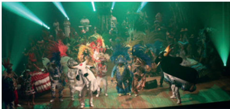
Após dois anos sem festa, os bois-bumbás Caprichoso e Garantido esperam o maior festival de todos os tempos para suas nações

“O festival vai além da festa, ele é fundamental para o desenvolvimento econômico não só do